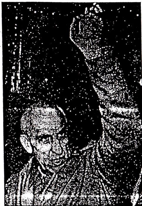
● دکتر محمد مصدق در دادگاه نظامی

ساختن چهره او که در میان مردم همچنان نماد آزادی و دموکراسی بود، از هیچ کوششی فروگذار نکرد. از جمله اندیشمندان شاهنشاهی اتهام قانون شکنی را، که سلاح مبارزه مخالفان برای ساقط کردن دولت او بود، تا پایان عمر رژیم، به هر مناسبتی عنوان می نمودند. از آن زمان تاکنون نیز، بعضی مدعیان تاریخ نویسی، به استناد گفته آنان، این اتهام را بدون مطالعه و تحقیق کافی، تکرار می کنند.