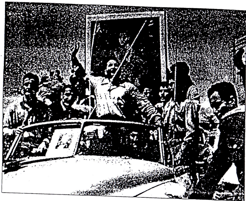
● شهبان جعفری همراه طرفداران شاه در ۲۸ مرداد ۱۳۳۲

«قوای ثلاثه مزبور [مقننه - قضائیه - اجرائیه] همیشه از یکدیگر ممتاز و منفصل خواهد بوده. متمم قانون اساسی ایران از قانون اساسی ۱۸۳۱ بلژیک گرفته شده است، غیر از بعضی احکام مربوط به موازین شرعیه، عمدتاً ترجمه از آن قانون است. با مقایسه این دو متن ملاحظه می‌کنیم که اصل بیست و هشتم ما (منشأ قوای مملکت)، عیناً ماده ۲۵ بلژیک است. اصل بیست و هفتم ما (قوای مملکت) - غیر از شرط عدم مخالفت با موازین شرعیه - مجموع مواد روی هم ریخته ۲۶ تا ۳۰ بلژیک است و اصل بیست و نهم ما (انجمن‌های ایالتی و ولایتی) ماده ۳۱ بلژیک است. ولی اصل ۲۸ ما در قانون اساسی بلژیک معادلی ندارد. دقیقاً روشن است که قانون نویسان ما، این اصل بیست و هشتم (امتیاز و انفصال قوای ثلاثه) را از قانون اساسی دیگری - احتمالاً از قانون اساسی ۱۸۴۸ فرانسه - گرفته‌اند و بعنوان ترمز سرکشی‌های محمدعلی شاه قانون‌شکن و قلدر، بین اصل بیست و هفتم و بیست و نهم جا داده‌اند.