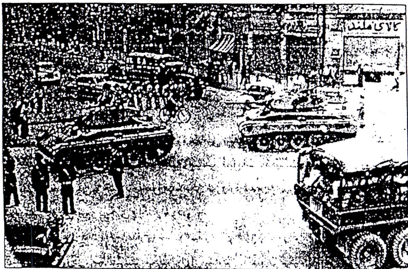
● تهران - روز ۲۸ مرداد ۱۳۳۲

تا آنجا که بعضی کشورها لازم دیده‌اند که برای سهولت کار، و شاید احتراز از چون و چرای مخالفان سیاسی، این تکنیک حکومت را در قوانین اساسی شان صریحاً پیش‌بینی کنند. از جمله قانون اساسی کنونی جمهوری فرانسه، مقرر داشته که دولت می‌تواند برای اجرای برنامه‌اش از پارلمان اختیار بگیرد که برای مدت محدودی، از طریق لوایح قانونی، به وضع قوانین لازم بپردازد.* و این در حالی است که اصل انفصال قوا همچنان مورد نظر است. هر چند در متن قانون نیامده ولی اعلامیه حقوق بشر و شهروند انقلاب کبیر - ۱۷۸۹ - بعنوان مقدمه قانون مزبور حفظ شده و اصل انفصال قوا در ماده ۱۶ این اعلامیه مذکور است. این یادآوری هم لازم است که در ایران نیز تفویض اختیارات از طرف مجلس شورای ملی به وزیران سابقه دارد. برای نمونه: به دکتر مصدق، وزیر مالیه، آبان ۱۳۰۰ - به مستشار امریکائی، دکتر میلیسپو، رئیس کل مالیه ایران، مرداد ۱۳۰۱ - به علی اکبر داور، وزیر عدلیه، بهمن ۱۳۰۵... و گفتنی است که بعضی از منتقدان اختیارات اخیر مصدق، که آن موقع و در آن موارد امکان و اقتدار انتقاد داشتند، ساکت مانده بودند.