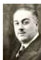
Diego Martínez Barrio