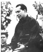
José Antonio Primo de Rivera