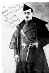
Ernesto Giménez Caballero