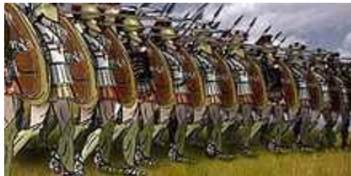
یک یکان نظامی در یونان باستان موسوم به فالانکز (phalanx)

بدنبال پیروزی نیروهای جمهوریخواه و چپ در انتخابات ۱۹۳۱ و اعلام جمهوری دوم ، راست اسپانیا که اندک اندک از گيجی ضربه وارده بیرون آمده ، به سازماندهی خود می پردازد . اولین واکنش کیفی "راست" بنیانگذاری حزبی به تقلید از احزاب موجود در آلمان و ایتالیا اما با ویژگی های فرهنگی خاص اسپانیاست. تنها سه سال پس از پایان دیکتاتوری و مرگ ژنرال میگل ریورا ، فرزند او "خوزه آنتونیو" حزب فالانژیست اسپانیا را پایه گذاری می کند. "خوزه آنتونیو" اگر تنها کسی نباشد که در ادبیات اسپانیایی از او با نام کوچکش یاد می شود حتما از نادرترین هاست . درباره فالانژیسم در ایران برخلاف نازیسم و فاشیسم ، بسیار کم نوشته شده و کمتر از آن نیز بررسی گردیده است. این نام در منظر بسیاری از ایرانیان یا جمعی چماقدار را تداعی میکند که ازار رسیدن به اهداف سیاسیشان ، نه بحث و منطق که زور و قلدری و اعمال خشونت است و یا اینکه در بهترین حالت فالانژهای لبنانی و اعضای حزب الکتائب لبنان را بخاطر می آورد . بهرحال واژه فالانژ برگرفته از نام یک دسته بندی جنگی پیاده نظام در یونان قدیم می باشد که شامل صفوف بهم فشرده سربازان مسلح به نیزه کوتاه و سپر بوده است. به عبارت دیگر این نام ، یک جبهه متحد با صفوفی فشرده و انضباطی آهنین را تداعی می کند.