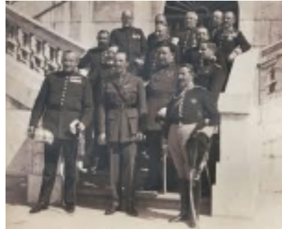
آلفونس سیزدهم همراه با نخست وزیرش " ژنرال میگل پریمو ریورا"

تأثیرات بلافصل پیروزی فاشیسم در ایتالیا ، کشورهای دیگر اروپایی از جمله اسپانیا را نیز بی نصیب نمی گذارد. دیکتاتوری هفت ساله "پریمو ریورا" اگرچه هیچ گرایشی به فاشیسم ایتالیایی ندارد با اینحال زمینه ساز شکل گیری هسته های اولیه تفکر فاشیستی در اسپانیاست. آلفونس سیزدهم طی دیدار خود از ایتالیا در این ایام بصراحت حیطة این تأثیرات را به نمایش می گذارد. او خطاب به موسولینی و با اشاره به ریورا و در مقام معرفی او میگوید این "موسولینی من" می باشد . اندیشه فاشیسم که ابتدا به ساکن و در جریان درگیریهای مستمر دوران جمهوری جوان اسپانیا خود را به مثابه موجی نیرومند بارز کرده است نهایتاً در دوران حاکمیت سیاه فرانکو و در غالب ملغمه "فرانکوایسم" تثبیت می گردد .