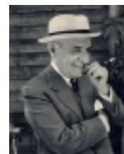
José Ortega y Gasset