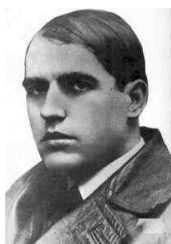
Ramiro Ledesma Ramos

سرنوشت خلبان روییز دو آلدو نیز چندان متفاوت نیست او که بدنبال موج دستگیریهایی تابستان ۱۹۳۶ به زندان انداخته شده است پس از مدت زمانی بسیار کوتاه و در جریان یک بلوای هدایت شده توسط مسئولین زندان همراه با فرناندو برادر دیگر خوزه آنتونیو به قتل می رسد . سندیکای دانشجویان فالانژ و تشکیلات شبه نظامی حزب فالانژ از کارهای آلدو است . او که تبحر چندانی در سخنوری ندارد ، در پشت صحنه و در نقش عالیجناب خاکستری عمل می کرده است . و اما نفر سوم بنیانگذار فالانژ اسپانیا یعنی والیکاساس دو هفته بعد از مراسم تأسیس حزب ازدواج کرده و به ماه عسل می رود ! در بازگشت ، ریورا مسئولیتهای او را خود بر عهده گرفته است ! او تا سال ۱۹۳۴ بیشتر دوام نمی آورد و "فالانژ اسپانیا د لا جونز" را ترک می کند . او که گرایشات غلیظ سلطنت طلبانه دارد در سال ۱۹۳۸ وارد اولین کابینه فرانکو می گردد و تا سال ۱۹۹۳ نیز زنده می ماند.