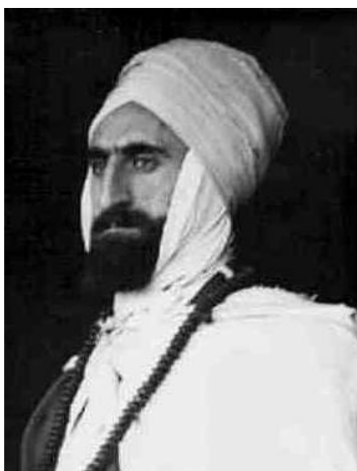
Frithjof_Schuon فری شوف شوون

ولی فقیه، نه تنها از دخمه‌های صفویه سده میانه، که ۵۰۰ سال بعد، در هزاره سوم، از سوی استاد ژئوفیزیک، دکتر حسین نصر و ولی‌رضای وی نیز برای پیشبرد اهداف سرمایه در خاورمیانه، تئوریزه و مسلح می‌گردد، و مشروعیت می‌یابد. به این گونه، دارهای ولایت مطلقه سرمایه در ایران، به دست این نخبه گان سیاسی و ایدئولوژیک برپا، تا با ترکیب بمب، مصلحت سرمایه در میلیتاریسم جهانی، مهندسی شود.